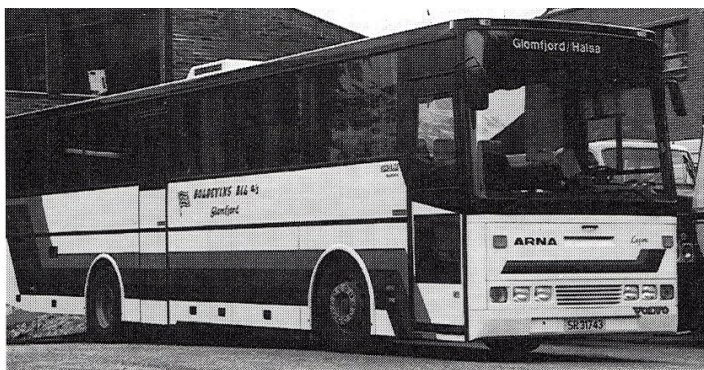
En av selskapets nyeste busser.

Men bedriften kan likevel i 1993 se tilbake på 60 år på veien – som distriktets tjener !!