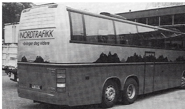
Selskapets nye farge og profil på bussene.